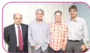
Juizes visitam Santa Casa Página 5