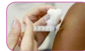
Vacine-se contra a gripe Página 11