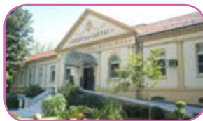
Santas Casas assinam "Carta de Salvador" Página 6