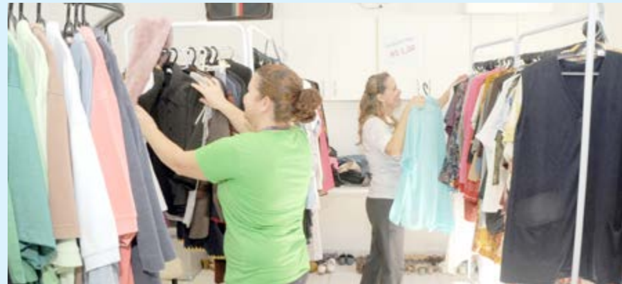
Mais de três mil peças foram doadas por pacientes, médicos e funcionários

Engana-se quem acha que roupas, sapatos, acessórios, eletrodomésticos e outros utensílios usados só servem para ser jogados no lixo ou esquecidos no armário. O sucesso da feira de ‘brechós’ organizada pelo terceiro ano consecutivo pelo CECAN- Centro do Câncer da Santa Casa mostra que esses objetos podem e devem ser reutilizados, tornando-se úteis para outras pessoas.