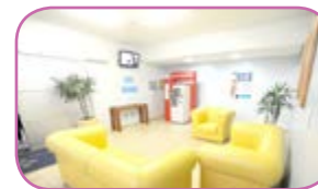
Funcionários ganham Área de Descanso Página 10