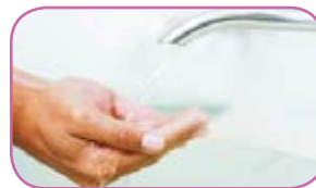
A importância da lavagem das mãos Página 9