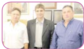
Monte Alegre e Santa Casa Saúde Página 4